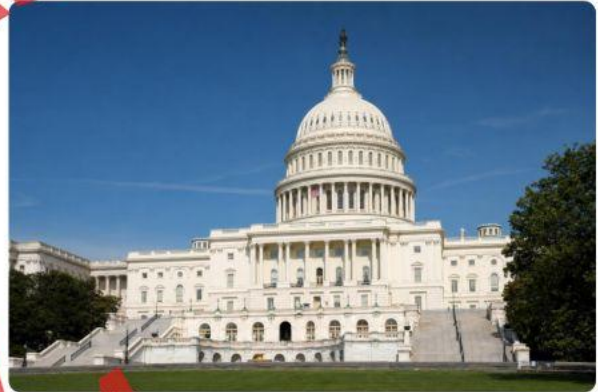
El Capitolio de EE. UU. es el hogar del Congreso — la rama legislativa — donde senadores y representantes debaten y votan sobre leyes propuestas.

El Congreso es el órgano legislativo del gobierno federal. Tiene dos partes: el Senado (100 senadores, dos de cada estado) y la Cámara de Representantes (435 miembros, según la población de cada estado). Juntos, redactan, debaten y votan