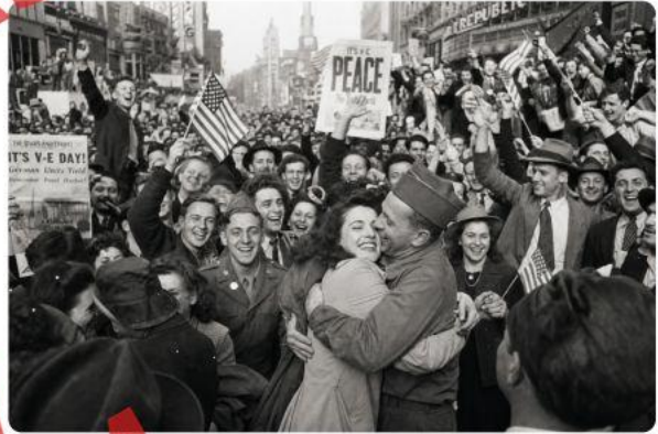
El 8 de mayo de 1945, personas de toda Europa y América del Norte inundaron las calles para celebrar el fin de la Segunda Guerra Mundial en Europa, conocido como el Día V-E.

Imagina vivir casi seis años en un miedo constante — sirenas de bombardeo, escasez de alimentos y las noticias diarias de seres queridos perdidos en batalla. Luego, el 8 de mayo de 1945, la radio crepita con un anuncio que lo cambia todo: la guerra en Europa ha terminado. Multitudes se vuelcan en las calles de Londres, París, Nueva York y Moscú, llorando y festejando al mismo tiempo. Este fue el Día de la Victoria en Europa — Día V-E — uno de los momentos más significativos del siglo XX. Pero ¿cómo llegó el mundo a ese momento, y qué significó para el futuro? Para entender verdaderamente el Día V-E, necesitamos examinar el colapso final de la Alemania nazi, los descubrimientos horripilantes que hicieron los soldados aliados en el camino, y las difíciles decisiones que los líderes mundiales tomaron sobre lo que vendría después.