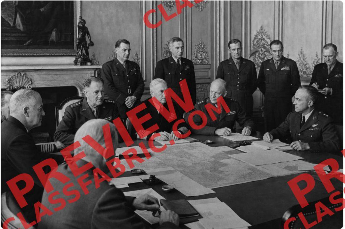
Los líderes aliados se reunieron en conferencias como Yalta y Potsdam para negociar el futuro de la Europa de posguerra, decisiones que darían forma a la siguiente mitad de siglo de la historia mundial.